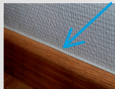
Câble Ethernet diamètre 2.3 mm