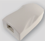
Boîtier RJ45 de raccordement