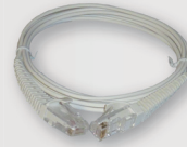
Cordon RJ45 Fast Ethernet